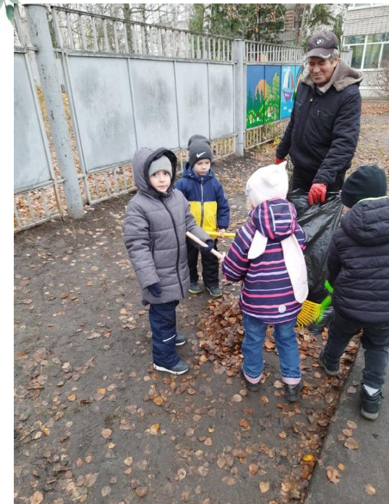
Помощь дворнику на участке