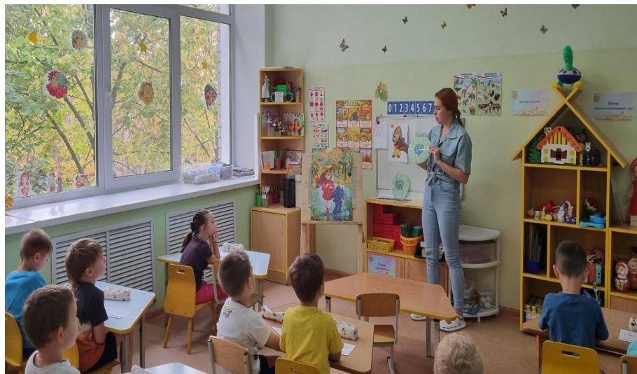
Игра на липучках «От чего радуется и страдает наша планета»