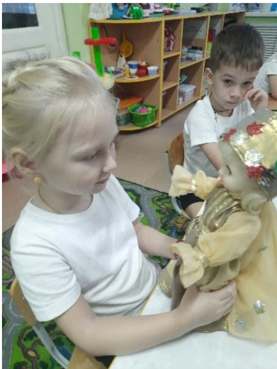
Собери куклу по погоде