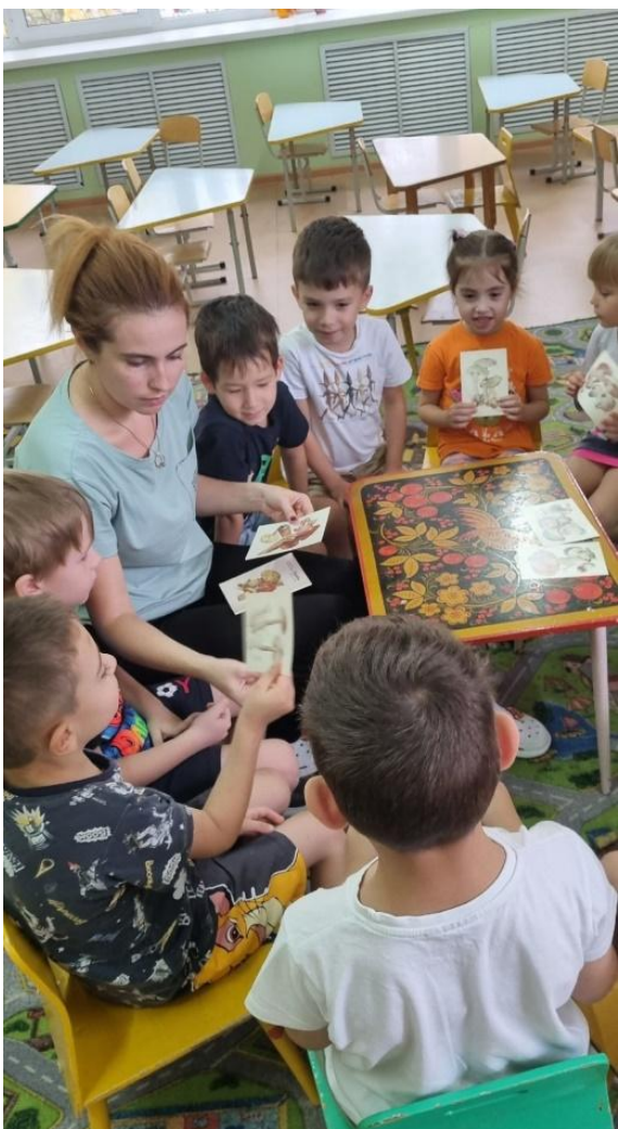
Игра «Найди гриб по описанию»