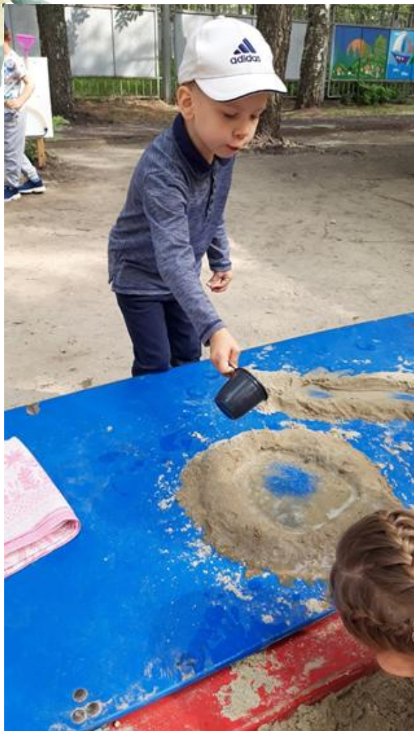
Создание «Озера и речки»