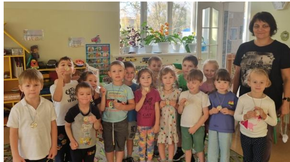
Награждение детей медалями за их труд и заботу за окружающей средой