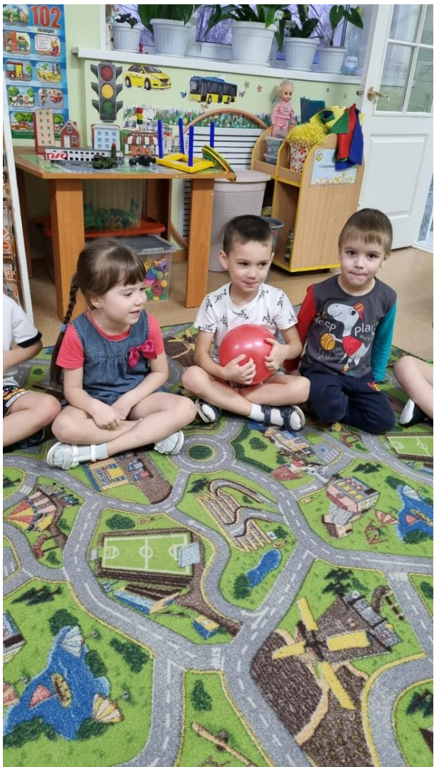
Малоподвижная игра «Живое не живое»