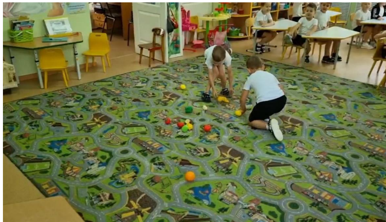
П/и «Собери овощи и фрукты»