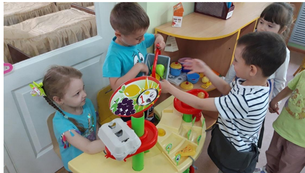
С/р игра «Магазин»