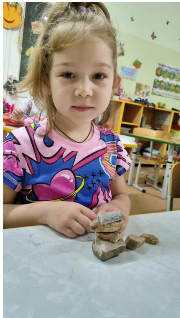
Игра с п/м «Кто выше постоит»